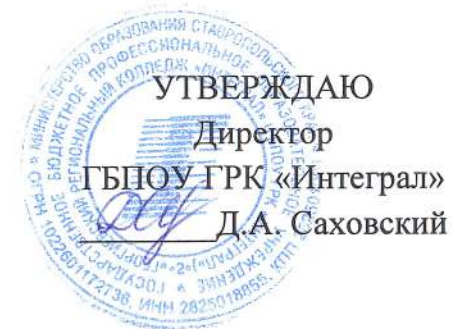
График работы секций оздоровительно-спортивного профиля ГБПОУ ГРК «Интеграл» на 2023 – 2024 учебный год.