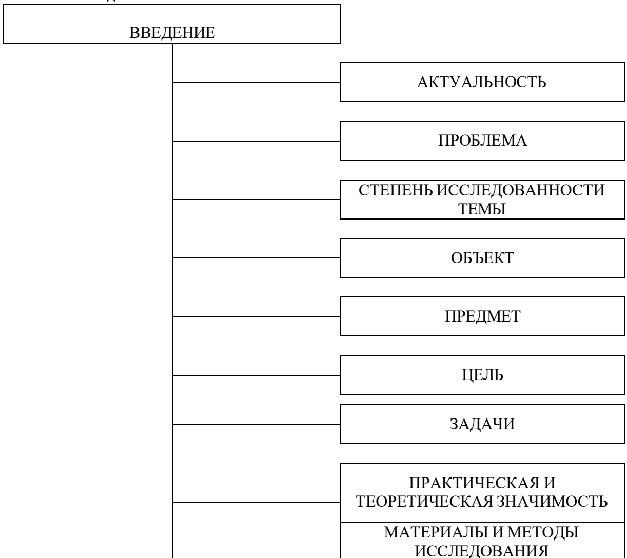
Рисунок 1 – Общая структура введения

Во введении дается обоснование выбора темы, раскрывается её актуальность, подтверждаемая статистикой, фактами. Затем автор раскрывает степень разработанности данной проблематики в литературе, указывает авторов и исследования по выбранной теме. Формулируется проблема, определяются временные, территориальные, организационные границы исследуемой проблемы. Далее формулируются объект, предмет, цель и задачи выпускной квалификационной работы, источники и методы исследования, структура. Важным пунктом введения является практическая значимость выбранной темы, где автор указывает, с решением каких конкретных задач документационного обеспечения управления связано его исследование.